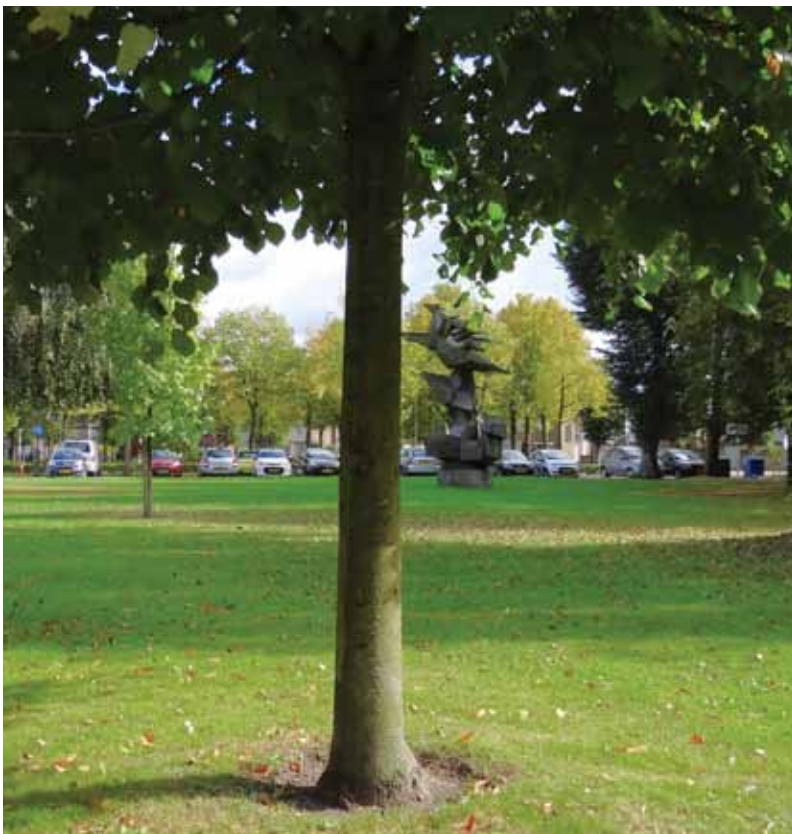
Ouderkerkpark. Zomerlinde met Evolutie op de achtergrond