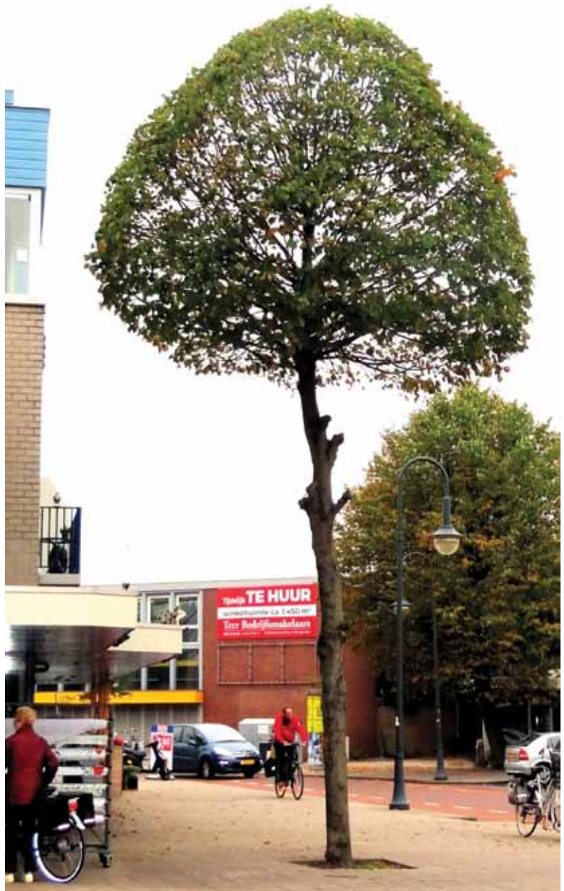
De Dillenburg-linde in Heemskerk

ook de naamcombinatie 'Dillenburg-linde ( Tilia xeuropaea 'Pallida')' tegen 5 . En Van der Bom ging er van uit dat 'zijn' boom een Hollandse Linde was. Om aan alle naamsverwarring een eind te maken heb ik bladeren verzameld uit de kruinen van de relevante Linden uit Delft, Etten-Leur en Heemskerk en verschillende Linden uit Arboretum Oudenbosch. De scans in de bijgevoegde figuur zijn van bladeren met een per boomkruijn min of meer gemiddelde bladgrootte. Nadere inspectie toonde aan dat de drie bomen in het Arboretum de juiste naam hebben. Dat is een prestatie als je weet hoe vaak Linden in gemeentelijke waardevolle-bomenlijsten en zelfs in botanische tuinen onjuist gelabeld zijn.