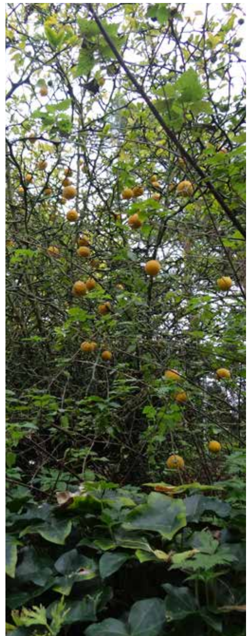
Rijkdragend in november.