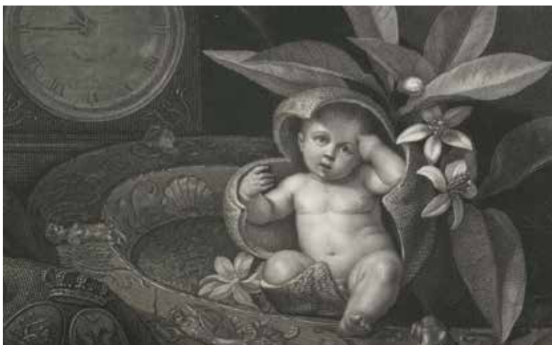
Geboorte toekomstige koning Willem III, 1817. Prent van J.J. Woff ( www.rijksmuseum.nl )

Omdat ze in ons klimaat niet winterhard zijn werden hier ter gelegenheid van hoogtijdagen van het Oranjehuis geen sinaasappelbomen buiten geplant. Wel stond er in september 1898, bij het grote inhuldigingsfeest van koningin Wilhelmina in de Dierentuin van Den Haag, pontificaal een bloeiende sinaasappelboom bij de ingang. Er werd ter gelegenheid van die inhuldiging maar één echte Oranjeboom geplant in Nederland. Dat was