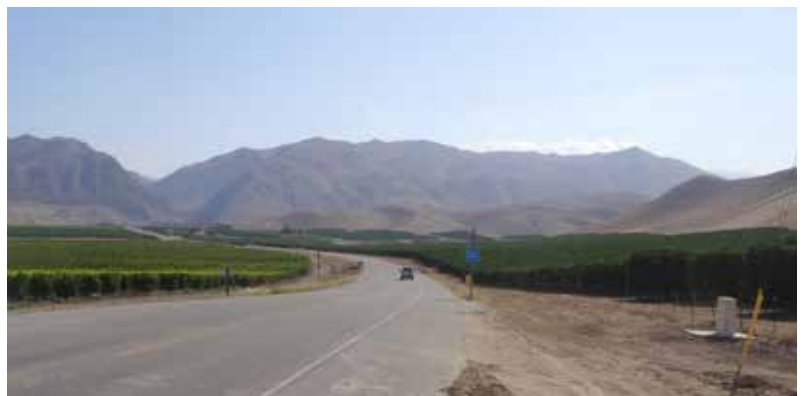
Sinaasappelboomgaarden in kurkdroog Californië

plaats van 'Oranjeappel'. Tussen 1870 en 1890 wordt Oranjeappel nog in ca. 35% van de gevallen gebruikt, in de jaren 1890 nog maar in 8% en vanaf 1950 in minder dan 0,5%. Appelsien is in ons land nooit populair geworden. In geen enkel decennium wordt het in meer dan 0,5% van de relevante krantenberichten over sinaasappels gebruikt. Vanaf 1870 is sinaasappel dus de meest gangbare naam, en vanaf 1950 effectief de enige. Deze taalverandering lijkt samen te hangen met de grootschalige aanvoer van sinaasappels uit het Middellandse Zeegebied die in de tweede helft van de 19 de eeuw op gang kwam. Door de opkomst van snelle zeilschepen en stoomschepen werden de transportkosten veel kleiner en werd het ook mogelijk de sinaasappels in de winkels te hebben vóór de houdbaarheidsduur van ongeveer drie weken verstreken was. Wellicht zijn slimme handelaren de naam sinaasappel gaan gebruiken om ze te onderscheiden van de 'gewone' oranjeappels die immers vaak zuur waren. Tegenwoordig zijn Brazilië en de USA (Florida en Californië) trouwens de grootste producenten.