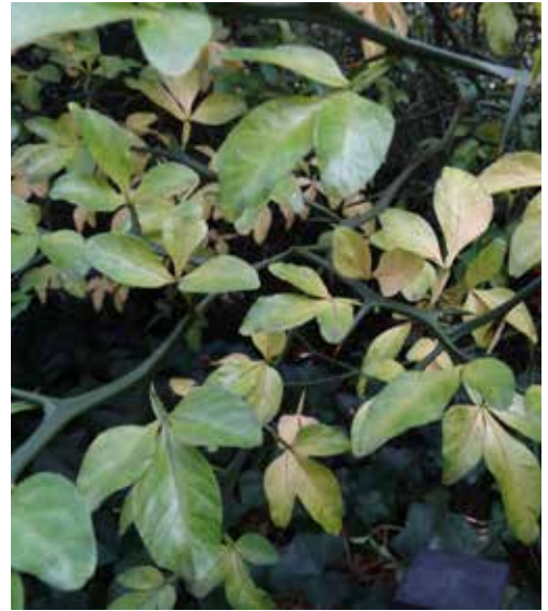
Citrus trifoliata , goed gewapend in de Katjeskelder.

De meeste citrussoorten zijn niet winterhard in Nederland. Maar er is één uitzondering: Citrus trifoliata L., die een tijdlang Poncirus trifoliata genoemd werd. Hij komt uit China en Korea en kan, als hij na een paar jaar goed aangeslagen is, behoorlijk wat vorst verdragen. Het is een langzaam groeiende struik die na vele jaren ongeveer 3 m hoog wordt. De groeiwijze is wat slordig, dus om een mooi boompje te krijgen moet je wel wat vormsnoei toepassen. Hij vraagt een goed doorlatende, humusrijke grond en in langdurig droge periodes een flinke watergift. Tijdens een verblijf op recreatiepark De Katjeskelder in Oosterhout zag ik er tot mijn verbazing een heel bosje met volwassen struiken van staan rond de midgetgolfbaan. De blaadjes zijn uiteraard drietallig-samengesteld en de rijpe vruchtjes donkergeel. Ze zijn kort en fijn behaard en voelen daardoor een beetje fluwelig aan. Eten zou ik ze maar niet: ze zijn heel erg bitter maar kunnen wel worden verwerkt in marmelade. Voor wie ze zelf in zijn tuin wil proberen: wees gewaarschuwd, ze hebben venijnige stekels van wel 4 cm lang. Wie dat zelf wil voelen, of wie de struik eens "in het echt" wil bekijken: in ons