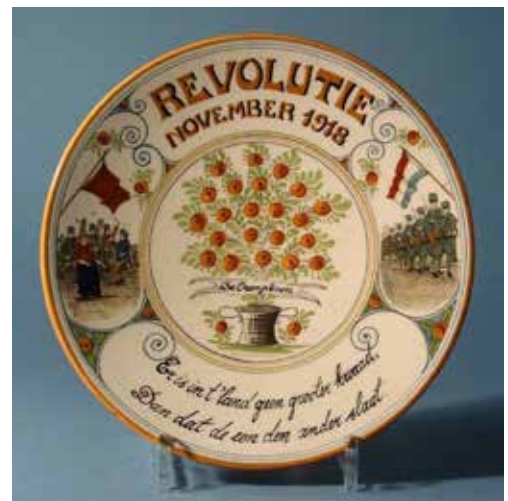
Mislukte revolutie 1918

niet in binnen onze huidige landsgrenzen, maar in een plaats in Texas die in 1897 door Nederlanders was gesticht. In de toen nog onafhankelijke Zuid-Afrikaanse Republiek werden, in Pretoria en Springs, ook Oranjebomen geplant om de troonsbestijging van Wilhelmina te vieren. Het streven naar hulp van Nederland zal daar, aan de vooravond van de Tweede Boerenoorlog met Engeland, niet vreemd aan zijn geweest. Net als in Nederland werden in onze kolonies in de Oost en West destijds her en der verschillende andere boomsoorten als 'Oranjebomen' geplant. In Oost-Indië was dat b.v. vaak Ficus benjamina . Dat gebeurde ook bij de geboorten van Juliana in 1909 en Beatrix in 1938. Hier en daar waren dat ook wel sinaasappelbomen. Maar in Europees Nederland speelden die bij hoogtijdagen van de Oranjefamilie alleen op afbeeldingen en in beschrijvingen een rol.