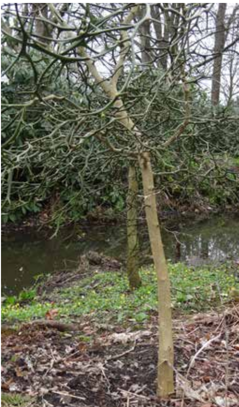
Begin april nog kaal.