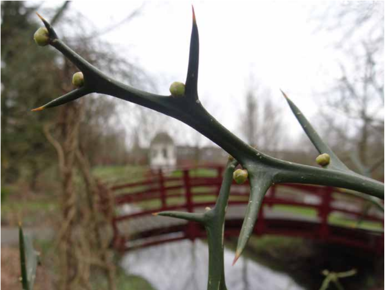
Afschikewekend maar veelbelovend. Eigen foto.