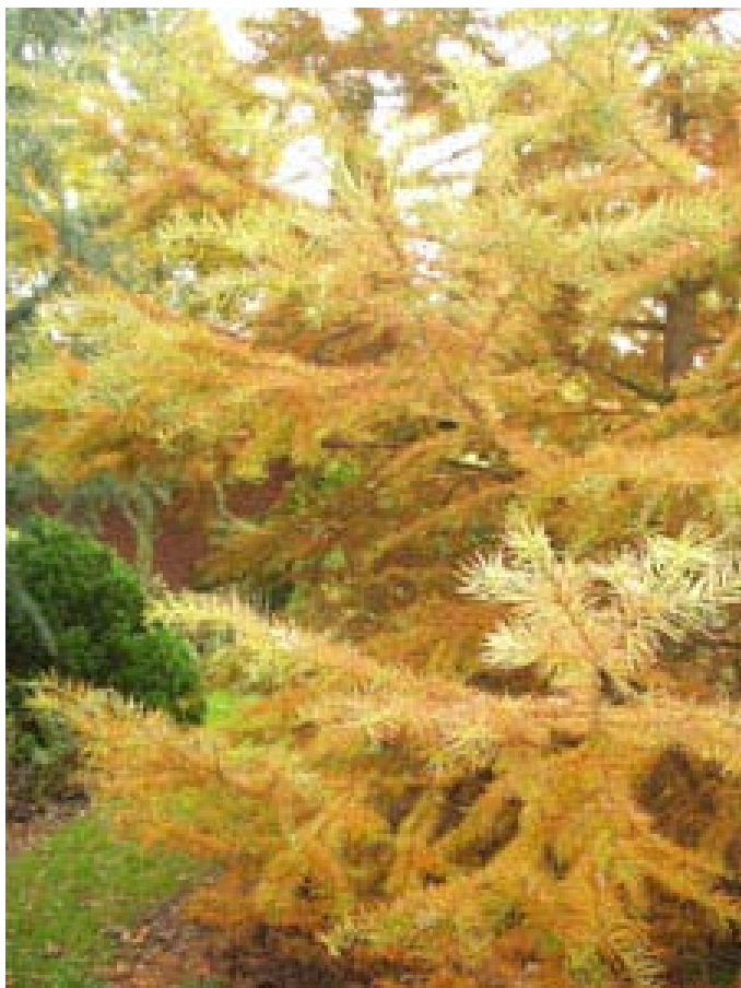
Goudlork, Pseudolarix amabilis ”

Blad dat aan het verouderen is en minder bladgroen bevat, wordt met een rode kleurstof beschermd tegen de zon.