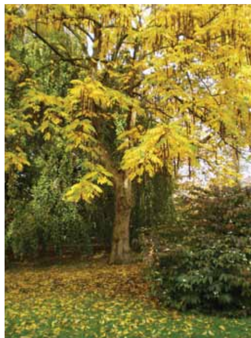
Pterocarya fraxinifolia , vleugelnoot

vrijwilligers, zoals die intern al jaren wordt ervaren, in dit verband wel de meest kritische succesfactor.