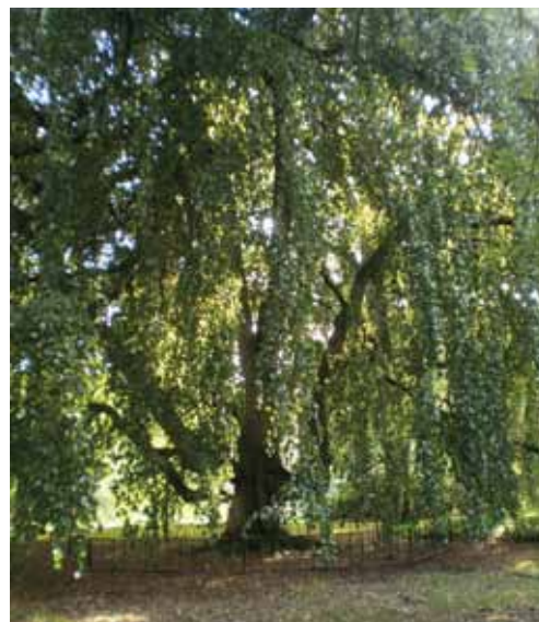
Treurbeuk, de oudste boom in het Arboretum

De publieke belangstelling legt een stevige maatschappelijke basis onder onze functie als 'botanic guardian' die we kunnen waarmaken via collectiebeheer, educatieve activiteiten en uiteraard het onderhoud van de tuin zelf. En daarvoor is weer een voldoende aanwas van vrijwillige medewerkers nodig. Overigens is de kracht van de onderlinge samenwerking onder